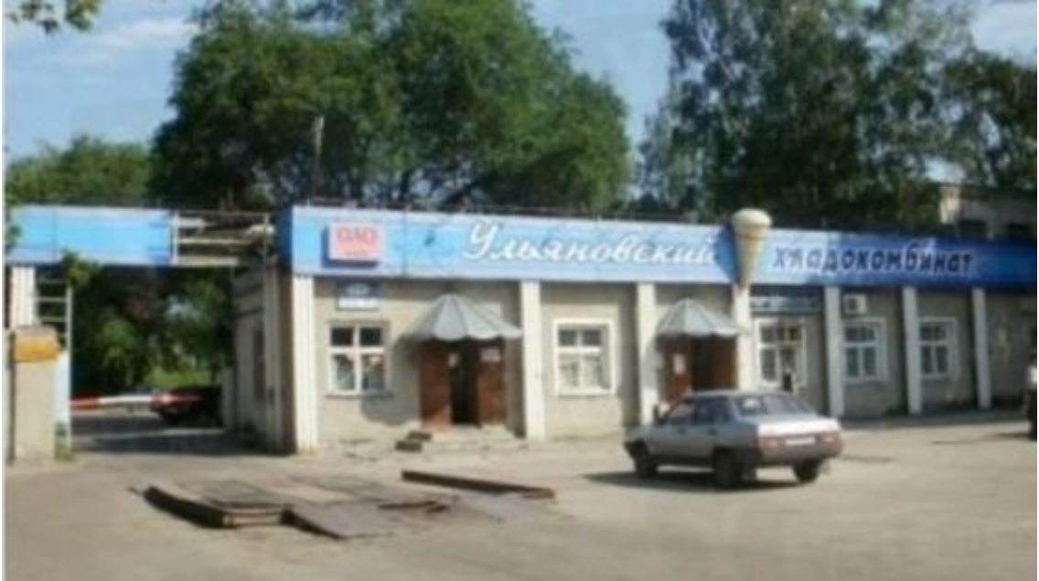
Фото с сайта https://73online.ru/